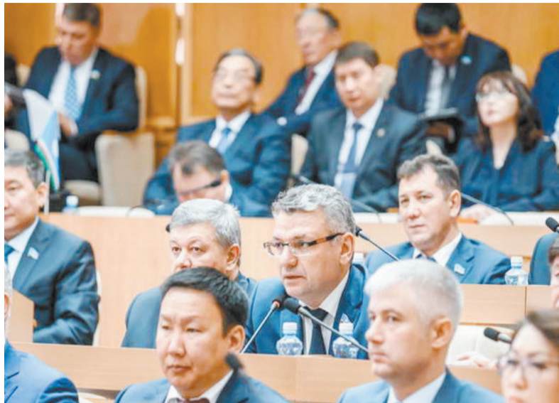
БЮДЖЕТ ЯКУТИИ ПРИНЯТ С ПОПРАВКОЙ ЛДПР

Позицией фракции ЛДПР по вопросу принятого бюджета